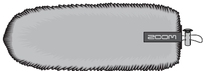
Cortavientos peludo WSU-2